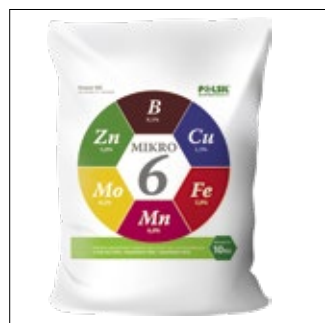
Masa netto: 10 kg