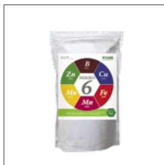
Masa netto: 1 kg